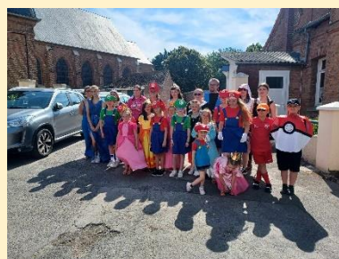
Photo prise lors de la fête locale